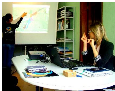
Figura 05 - Participación del Consorcio Intermunicipal para la Conservación del Relicto del Río Paraná y Áreas de Influencia - CORIPA en el Diagnóstico Participativo del Área de Protección Ambiental de las Islas y Várzeas del Río Paraná para el Plan de Manejo de la unidad de conservación (Gestión Compartida).