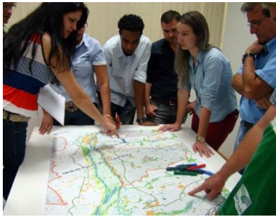
Figura 04 - Consejeros del APA Islas y Várzeas del río Paraná reconocen e identifican el territorio de la unidad de conservación por medio de oficinas de gestión participativa.