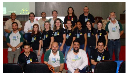
Figura 06 - Servidores del APA Islas y Várzeas del Río Paraná, Parque Nacional de Isla Grande y de los Consorcios Públicos, CORIPA y COMAFEN (Gestión Integrada y Compartida).

Por medio de la GCIP, la gestión del territorio fue más organizada, eficiente y eficaz, siendo referencia para instituciones asociadas. También se observó que los procesos y acciones se volvieron más ágiles y los servidores estuvieron más estimulados y motivados para trabajar (Figura 06). Con esta práctica el espíritu cooperativo fue incentivado, dando impulso a este modelo de gestión internamente junto al equipo de la unidad de conservación. El mayor aprendizaje fue el ejercicio de humildad, de no dudar en buscar ayuda con los socios más cercanos e incluso con los socios más inesperados en pro de la conservación de la biodiversidad.