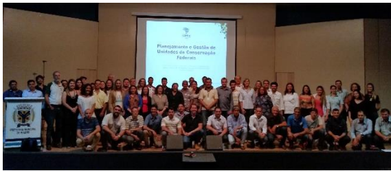
Figura 03 - Consejo Gestor del APA Islas y Várzeas del Río Paraná (Gestión Participativa).